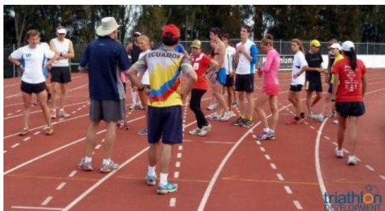
Jóvenes triatletas en un campamento de entrenamiento.

Por otro lado, la IJF acaba de conceder un octavo dan, uno de los grados más elevados en yudo, al presidente de la Federación de Rusia, Vladimir Putin, que el pasado 7 de octubre cumplió 60 años. Putin es presidente de honor de la IJF y un yudoka emérito y reconocido.