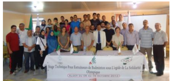
Los participantes en un curso para entrenadores en Argelia.