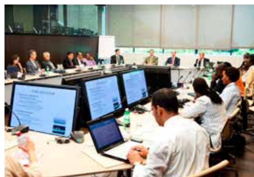
© 2016 / MEMOS (Thierry Zintz)